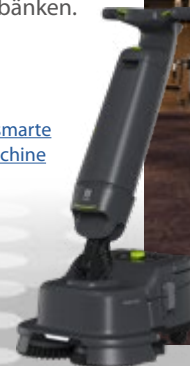
PUDU SH1 – unsere smarte Handscheuersaugmaschine

Während der autark arbeitende PUDU CC1 die Flächenreinigung übernimmt, sorgt der PUDU SH1 als handgeführtes Gerät für Sauberkeit bei Sportgeräten, Fenstern und schwer zugänglichen Stellen, wie beispielsweise unter Hantelbänken.