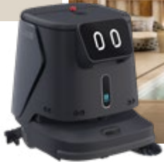
PUDU CC1 – unser autonomer Reinigungsroboter